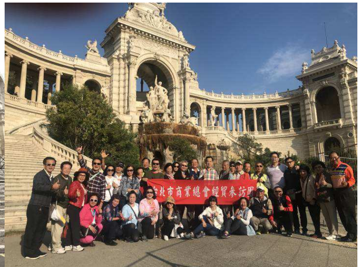
名列聯合國教科文組織世界文化遺產的阿爾勒古羅馬鬥獸場 (Arènes d' Arles) 以及富麗堂皇的馬賽隆尚宮 (Palais Longchamp) 都是法國南部知名地標，訪問團都曾留下足跡。