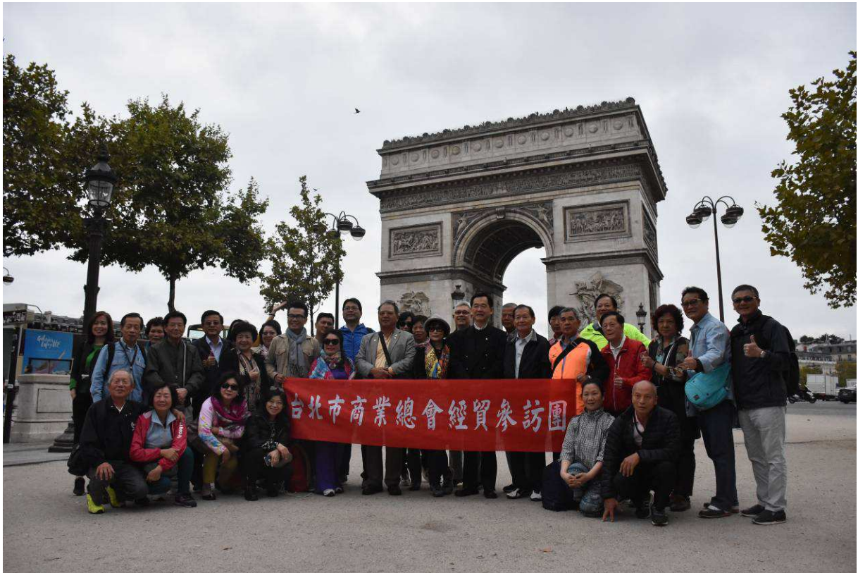
訪問團一行人抵達巴黎後，第一個走訪的景點就是鼎鼎大名的凱旋門。